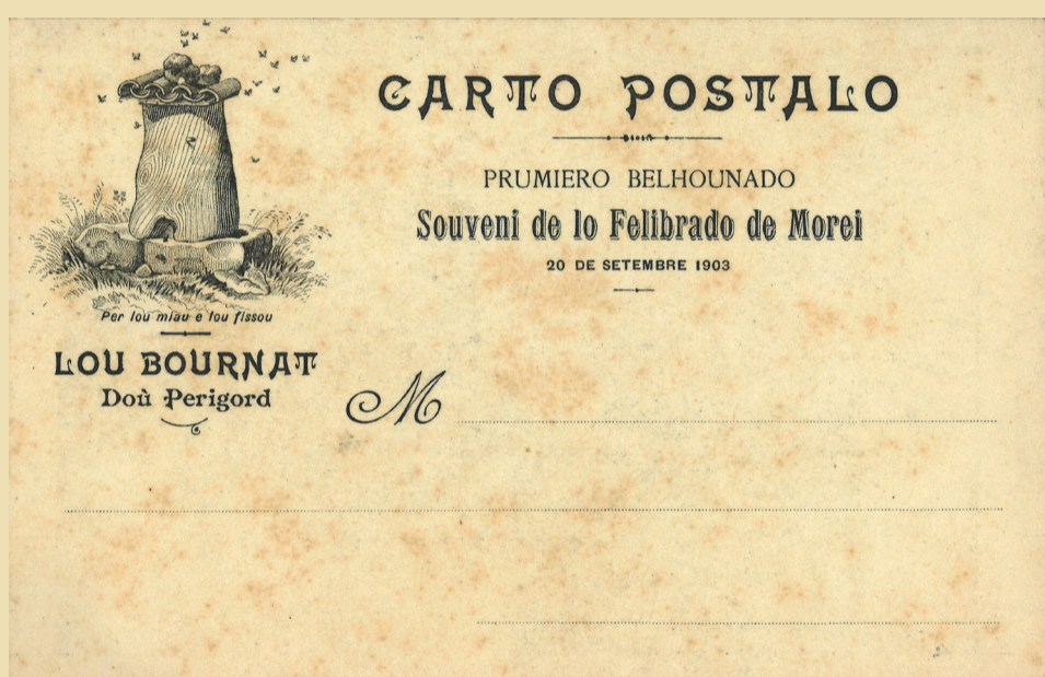
Carte postale de la première Félibrée de 1903 à Mareuil. Postal card of the 1st Félibrée - Mareuil 1903

Pour fêter le centenaire de l'association, une borie (cabane de berger en pierre sèche) a été construite dans le jardin public.